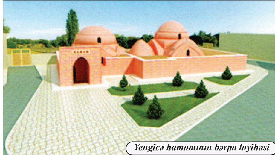
Yengicə hamamının bərpa layihəsi